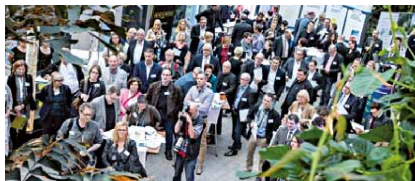
Immer gut besucht: Die VisitenkartenPARTY im Technologiezentrum Jülich.

Highlight des Veranstaltungsjahres 2017 ist die Visitenkartenparty am 20. Juni 2017, 18:30 bis 23:00 Uhr im Technologiezentrum Jülich. Rund 250 Unternehmer zieht der bewährte Mix aus guter Atmosphäre, Unternehmermesse und die Chance auf interessante, neue Unternehmenskontakte jedes Mal zur Visitenkartenparty nach Jülich. Denn die mittlerweile 9. Visitenkartenparty bietet gutes Networking, persönliche Kontakte und einen direkten Austausch mit regionalen Unternehmern. „Die Visitenkartenparty ist seit vielen